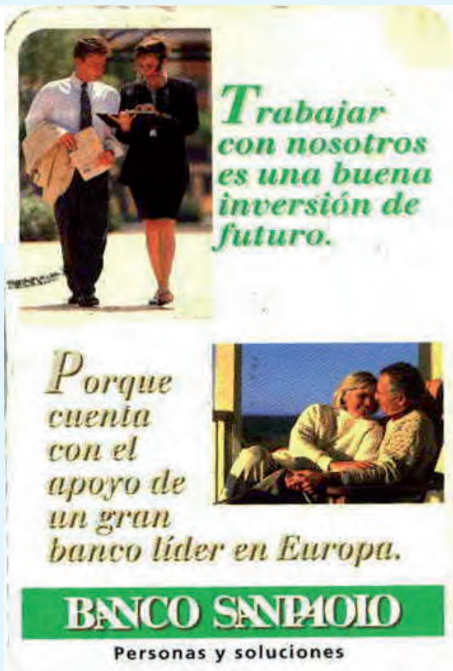
Memoria Banc Catalá de Credit 1968.