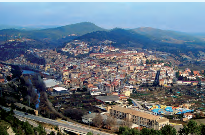
Vista general de Súrria

La villa de Súrria pertenece a la provincia de Barcelona y se halla situada en la zona de la Cataluña Central.