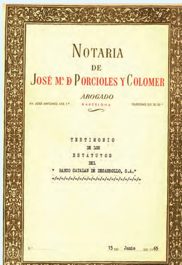
Estatutos del Banco Catalán de Desarrollo, 1965.