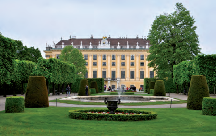
Palacio de Schönbrunn (Viena)