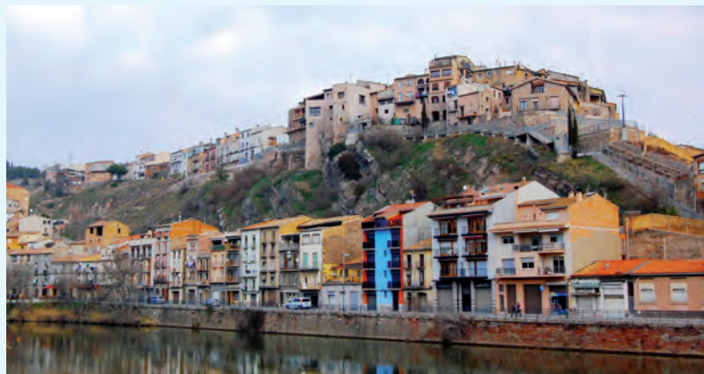
Poble Vell i barri de Sant Jaume

Actualmente Súria tiene 5.911 habitantes. Dos escuelas públicas y una privada. Un instituto de enseñanza media. La principal empresa es ICL Iberia dedicada a la extracción de sal y potasa (500 trabajadores). De la sal se obtiene diferentes productos que se dedican al deshielo de carreteras, a la industria y al consumo humano. La potasa va destinada a fertilizantes. Un tren va de Súria al puerto de Barcelona donde se realiza la exportación a todo el mundo. La segunda es Enric Roca, matadero avícola, con 50 empleados. La tercera es Remosa, dedicada a los derivados del poliéster, con otra fábrica en Noblejas (Toledo), (30 trabajadores).