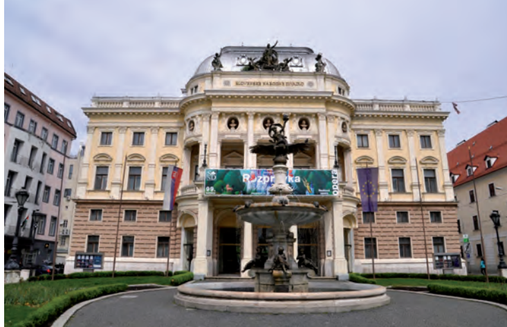
Bratislava, Teatro Nacional Eslovaco

Esteban, construida en el siglo XII como iglesia parroquial en estilo románico tardío. Tras un incendio en el siglo XIII se construyó la nave principal. En el siglo XV se terminó la torre, con 136 metros de altura. En el siglo XVI fue coronada con un yelmo renacentista. En el siglo XX sufrió un incendio y el techado se cubrió con doscientos cincuenta mil azulejos. Su nave central es de estilo gótico y su altar, barroco. Su púlpito es una obra maestra del arte gótico. En la catedral se encuentra el monumental sarcófago de Federico III.