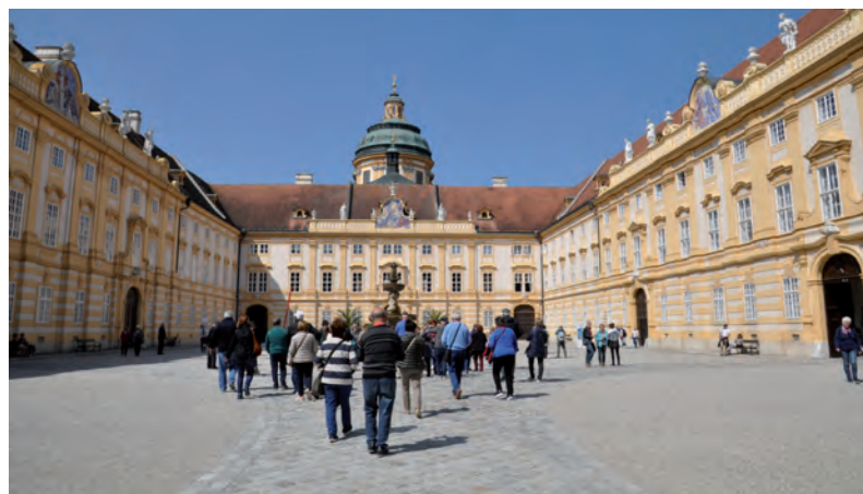
Abadía de Melk (Austria)

Lo mejor del Euroencuentro, aparte de lo visitado, es siempre el ambiente, respeto, educación y mucha alegría. Podríamos decir que en esta semana le hemos proporcionado a nuestra alma felicidad.