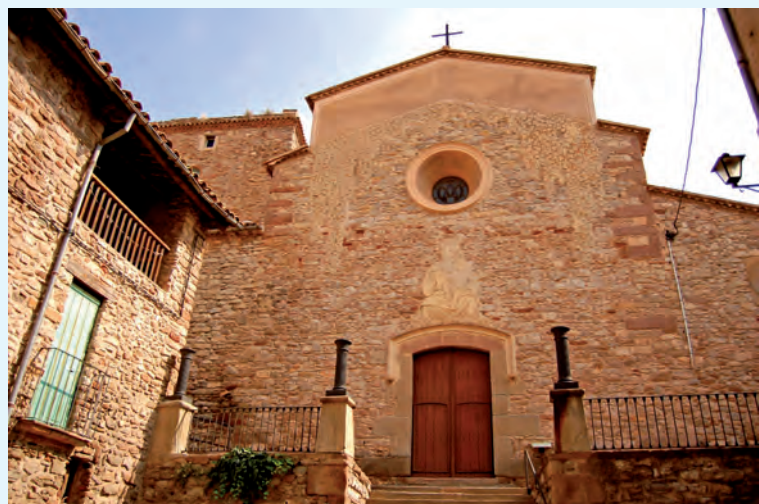
Iglesia del Roser