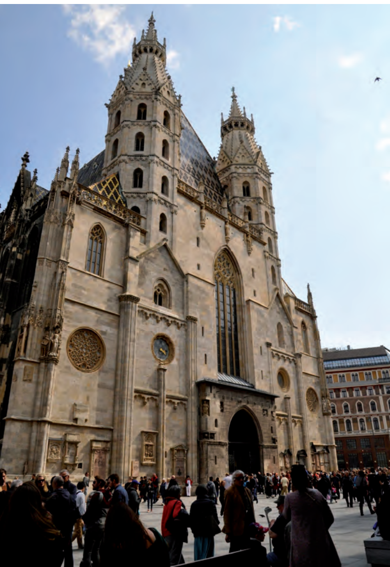
Catedral de San Esteban (Viena)

Paseando por la ciudad antigua, con hermosas calles, nos encontramos con la catedral de San